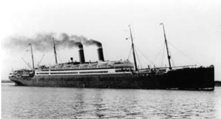
Parník „Amerika“ bol spustený na vodu v Belfaste v r. 1905. Viezol celkom 897 pasažierov, z toho 1. triedy 420, 2. triedy 254 a 3. triedy 223 pasažierov.

Parník „Kaiserin Auguste Victoria“ bol spustený na vodu v Štetíne v r. 1905. V tom čase bol najväčšia loď na svete. Viezol celkom 2 996 cestujúcich, z toho 1. triedy 652, 2. triedy 286 a 3. triedy 2 058 pasažierov.