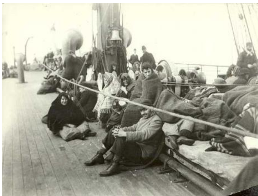
Vystáhovalci na palube parníka. Rok 1892

Cestujúci 3. triedy boli umiestnení v podpalubí, v malých izbách ležali ľudia na regáloch na jednoduchom slamníku, spolu muži, ženy aj deti. Strava bola minimálna, väčšinou sa museli stravovať zo svojich zásob. Pitná voda sa rozdávala na prídel len v časových intervaloch, alebo len raz do dňa. Hygiena bola nedostatočná, vzduchu v izbe málo, mnohých premáhala morská nemoc.