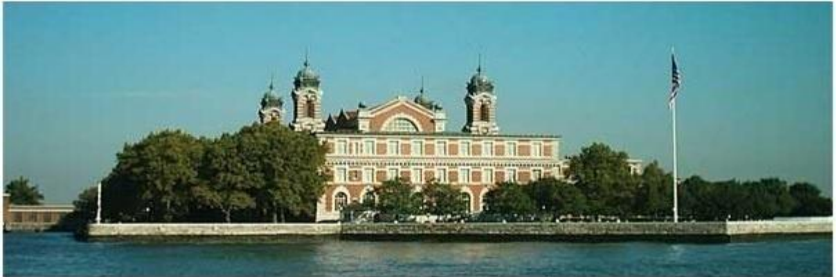
Budova Imigračného úradu dnes. V budove je múzeum pristáhovalectva „Ellis Island Immigration Museum“.

Po 15 až 60-tich dňoch – podľa rýchlosti plavby - pristála loď v prístave, pri móle East River v New Yorku. Vysťahovalci 3. triedy boli prevezení člnmi alebo trajektami na ostrov Ellis Island, kde sídlil Imigračný /pristáhovalecký/ úrad a kde museli Brezovičania prekonať poslednú prekážku na ceste za lepším životom.